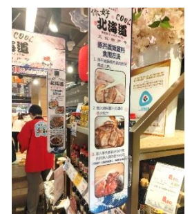
豚井の作り方パネル

すっかり毎年の春の定番となったこのフェアをきっかけに、ハルビンの皆様のお気に入りの道産食品が着実に増えていくことを期待しております。