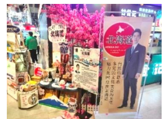
フェア会場入口の装飾

期間：2月24日（金）～3月8日（水）13日間 会場：①松雷百貨店南商店地下1階食品売場、②オンラインショップ 主催：北海道（事業受託：（株）T&Tフェニックス） 商品：日本酒、納豆、ラーメン、菓子、調味料等80品目