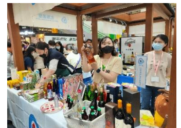
北海道ブースのにぎわい

週末の会場には、来場者が次々と押し寄せ、わずか6㎡の小さなブースの周囲は常に若者や家族連れであふれており、北海道の様々な魅力を、多数の皆様にご直接お伝えする絶好の機会となりました。